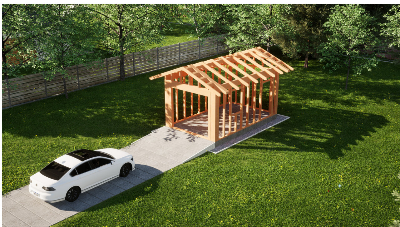
Widok konstrukcji: Garaz ERDOL G1 - Wersja prawa - Układ kalenicy prostopadły z dachem dwuspadowym o kącie nachylenia 25 stopni

Przedstawiona oferta ma charakter informacyjny i nie stanowi oferty handlowej w rozumieniu Art. 66 par. 1 Kodeksu Cywilnego oraz innych przepisów prawnych. Zamieszczone wizualizacje mają charakter poglądowy i nie mogą być traktowane jako ostateczne projekty realizacyjne.