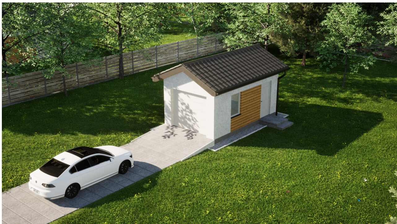
Garaż ERDOL G1 - Wersja prawa - Układ kalenicy prostopadły z dachem dwuspadowym o kącie nachylenia 25 stopni - Brama segmentowa z napędem IO, sterowana pilotem - UniPro WIŚNIEWSKI - Biały