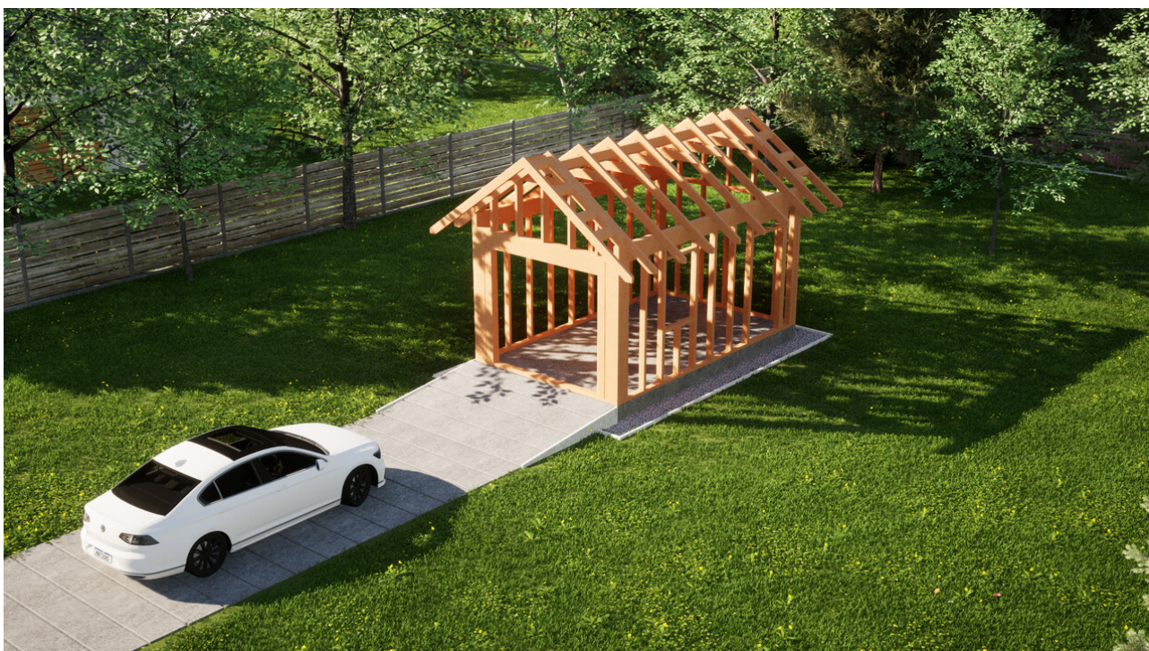
Widok konstrukcji: Garaz ERDOL G1 - Wersja prawa - Układ kalenicy prostopadły z dachem dwuspadowym o kącie nachylenia 35 stopni

Przedstawiona oferta ma charakter informacyjny i nie stanowi oferty handlowej w rozumieniu Art. 66 par. 1 Kodeksu Cywilnego oraz innych przepisów prawnych. Zamieszczone wizualizacje mają charakter poglądowy i nie mogą być traktowane jako ostateczne projekty realizacyjne.