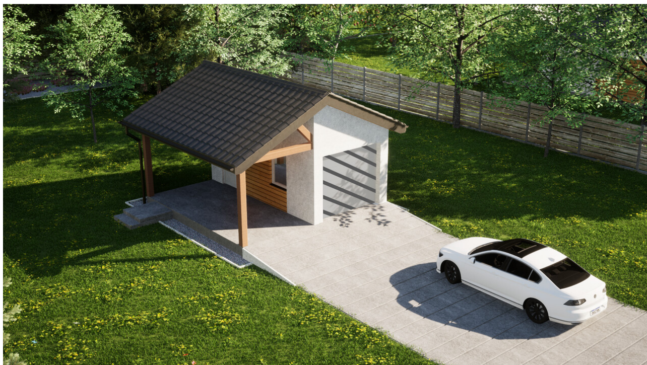
Garaż ERDOL G1W - Wersja lewa - Układ kalenicy prostopadły z dachem dwuspadowym o kącie nachylenia 25 stopni - Bez bramy - Białe