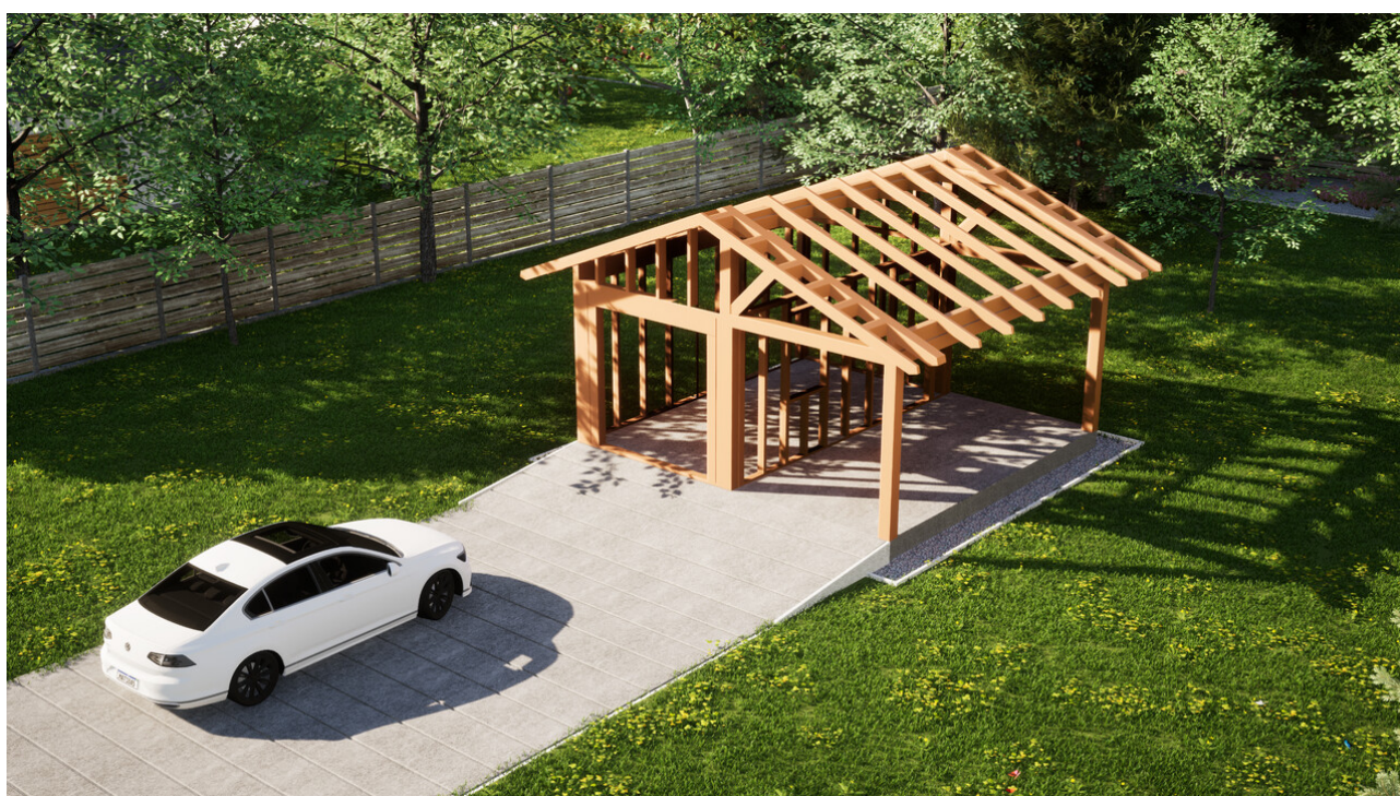
Widok konstrukcji: Garaż ERDOL G1W - Wersja prawa - Układ kalenicy prostopadły z dachem dwuspadowym o kącie nachylenia 25 stopni