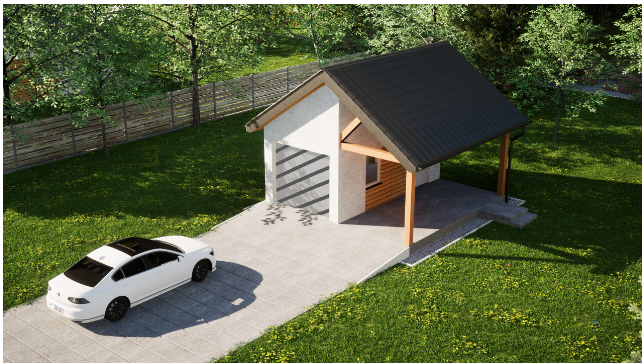
Garaż ERDOL G1W - Wersja prawa - Układ kalenicy prostopadły z dachem dwuspadowym o kącie nachylenia 35 stopni - Bez bramy - Białe