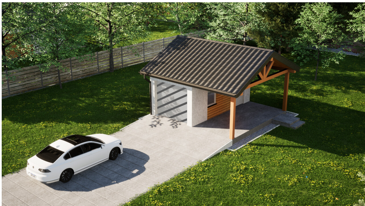
Garaż ERDOL G1W - Wersja prawa - Układ kalenicy równoległy z dachem dwuspadowym o kącie nachylenia 25 stopni - Bez bramy - Białe