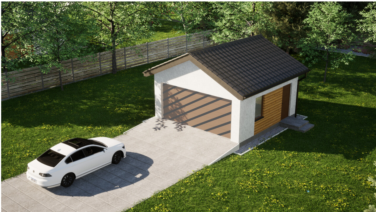
Garaż ERDOL G2 - Wersja prawa - Układ kalenicy prostopadły z dachem dwuspadowym o kącie nachylenia 25 stopni - Bez bramy - Złoty dąb