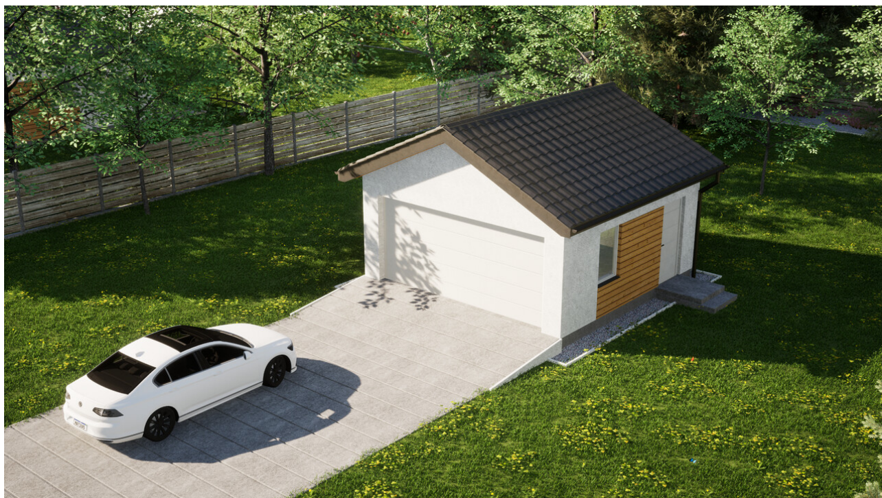
Garaż ERDOL G2 - Wersja prawa - Układ kalenicy prostopadły z dachem dwuspadowym o kącie nachylenia 25 stopni - Brama segmentowa z napędem IO, sterowana pilotem - UniPro WIŚNIEWSKI - Biały