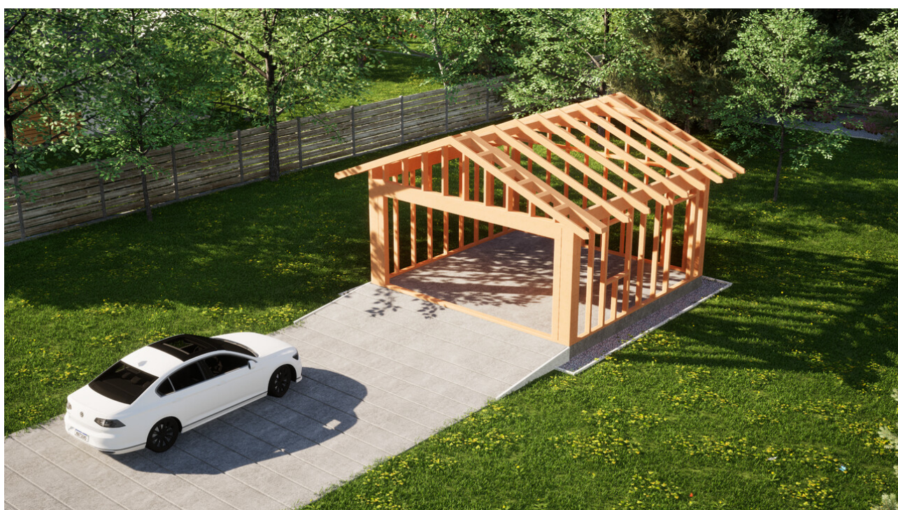
Widok konstrukcji: Garaż ERDOL G2 - Wersja prawa - Układ kalenicy prostopadły z dachem dwuspadowym o kącie nachylenia 25 stopni

Przedstawiona oferta ma charakter informacyjny i nie stanowi oferty handlowej w rozumieniu Art. 66 par. 1 Kodeksu Cywilnego oraz innych przepisów prawnych. Zamieszczone wizualizacje mają charakter poglądowy i nie mogą być traktowane jako ostateczne projekty realizacyjne.