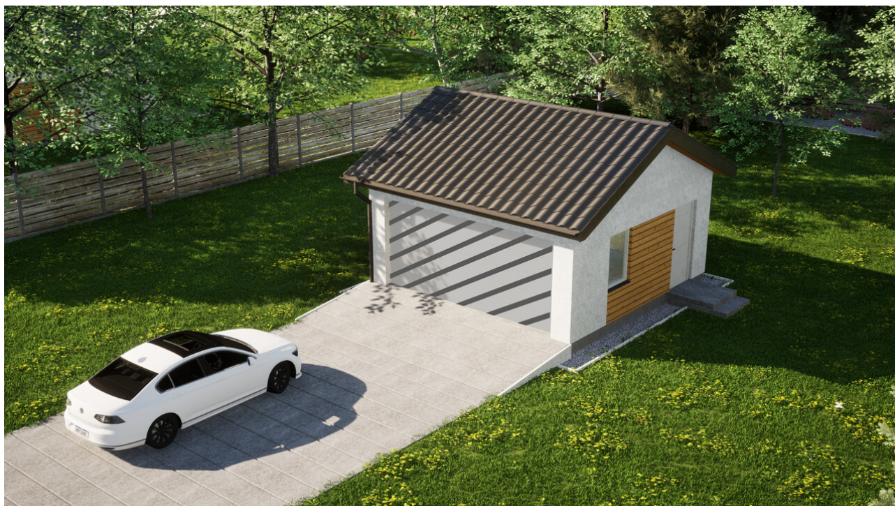
Garaz ERDOL G2 - Wersja prawa - Układ kalenicy równoległy z dachem dwuspadowym o kącie nachylenia 25 stopni - Bez bramy - Białe